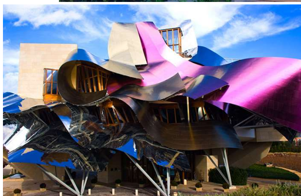
Рисунок 8.Сучасні архітектурні стилі

Твори архітектури завжди привертали увагу модельєрів, які черпають натхнення із спадщини архітектури різних часів і народів (архітектура Ле Карбюзье, Гауді, готичні собори і ін.).