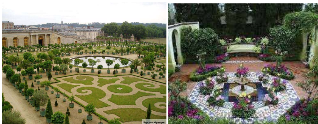
Рисунок 5. Ландшафтна та садово-паркова архітектура