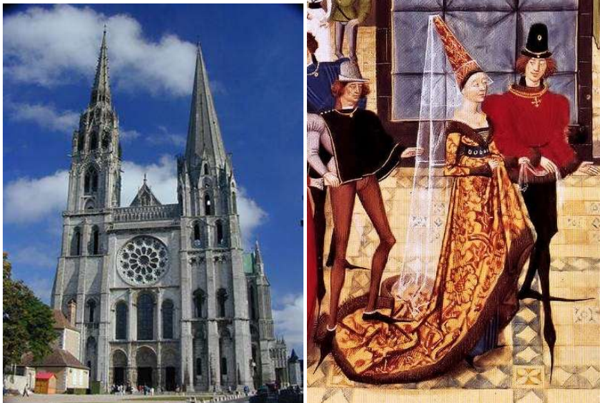
Рисунок 11. Архітектура та костюм готичного періоду

Кривизна ліній, різний ступінь їх емоційної напруженості викликають аналогію з лініями костюма. Наприклад, прямокутну форму, пропорції і легкість вертикальних ліній архітектурних споруд можна знайти у костюмі античного стилю; граничну функціональність форм, планування, матеріалів будівель – у прямокутній динамічній формі одягу XX ст., що проголосило нову естетику – естетику конструктивізму тощо.