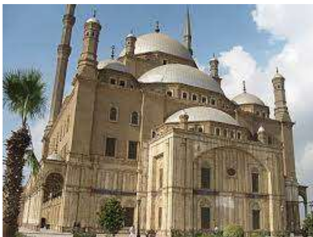
Рисунок 2. Культова архітектура