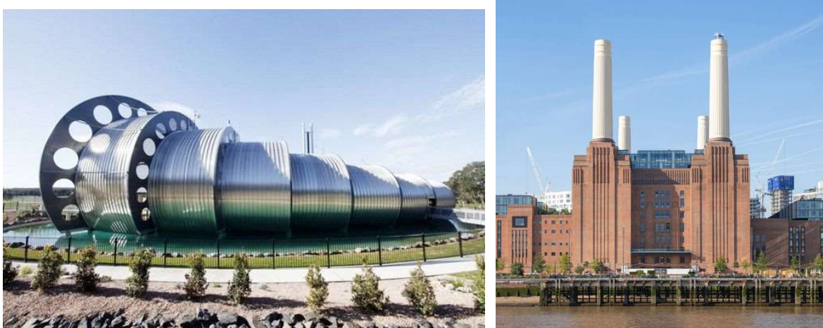
Рисунок 4. Промислова архітектура

Промислові споруди — це заводи, фабрики, електростанції.