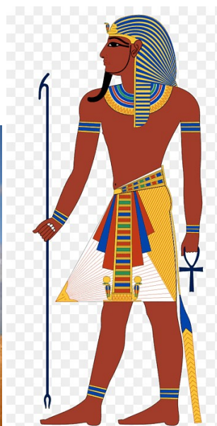
Рисунок 10.Архітектура та костюм Стародавнього Єгипту