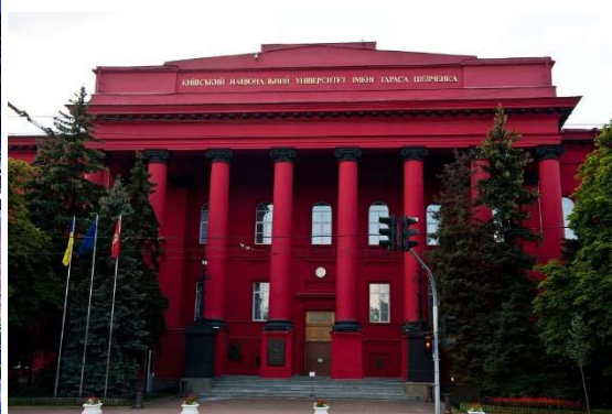
Рисунок 3. Громадська архітектура