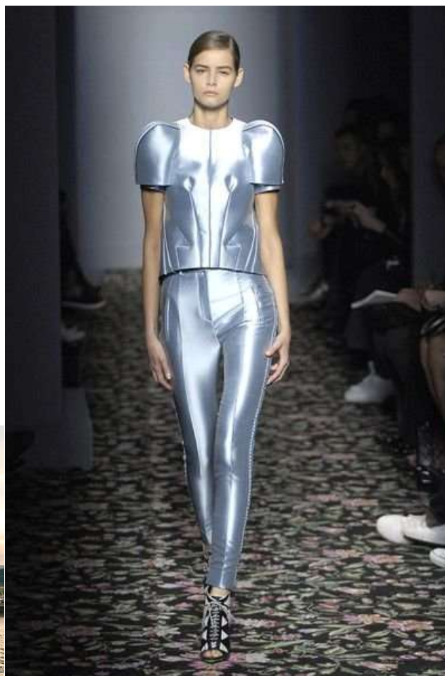
Рисунок 14. Колекція Balenciaga

Але насамперед розвитку архітектури як художнього явища сприяло зростання технічних можливостей людства. Після того як з'явилися нові технології, виникали передумови для нового архітектурного стилю, а разом з ним змінювався вигляд храмів, громадських будівель і приватних будинків. Але, як правило, новий стиль не був абсолютним запереченням минулого, він успадкував деякі його ознаки, в той же час породжуючи нові цікаві форми. Лише в новітній історії людства виникає ряд архітектурних стилів, що з'явилися як повне заперечення попередньої тисячолітньої мистецької спадщини, старих правил і методів архітектури.