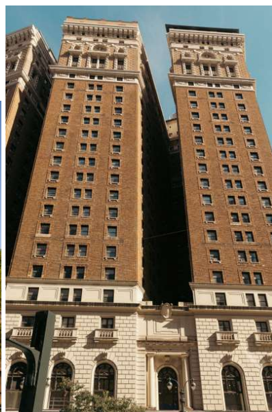
Рисунок 1. Житлова архітектура