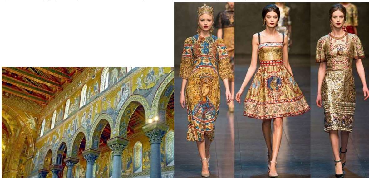
Рисунок 12. Колекція Dolce & Gabbana

Дизайнери одягу запозичують багато ідей, аналізуючи архітектурні пам'ятки різних народів, які залишились нам у спадщину. Це і є образні асоціації, які зароджуються у процесі творчого вибору, які часто бувають покладені як основа нової форми костюму. Проаналізувавши той чи інший зразок архітектури, дизайнер відбирає лінії, маси, форми, пропорційність членування архітектури, їх функціональність. Дизайнер аналізує, вивчає архітектуру, принципи побудови її мас, роботу матеріалу, його властивості.