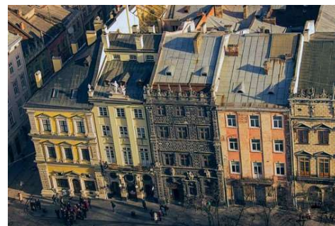
Рисунок 6. Містобудування

Кожній історичній епосі відповідає певний мистецький (або архітектурний стиль), що вплинув на костюм свого часу. Це пояснює органічний стильовий зв'язок між костюмом і архітектурою, яка виражається в єдності образного рішення, схожості силуету, принциповій схемі пропорційних відношень, тому архітектура є одним з яскравих творчих джерел при створенні костюма. Архітектура вчить художника гармонійній єдності костюма і навколишнього середовища.