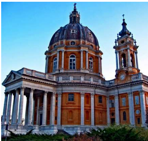
Рисунок 7.Класичні архітектурні стилі

До сучасних найбільш відомих архітектурних стилів можна віднести наступні: функціоналізм (конструктивізм), мінімалізм, постмодернізм, хайтек, деконструктивізм.