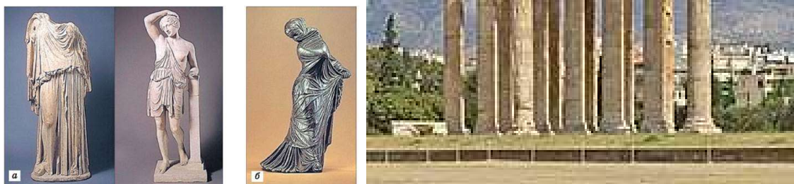
Рисунок 12. Архітектура та костюм античності

Кривизна ліній, різний ступінь їх емоційної напруженості викликають аналогію з лініями костюма. Наприклад, прямокутну форму, пропорції і легкість вертикальних ліній архітектурних споруд можна знайти у костюмі античного стилю; граничну функціональність форм, планування, матеріалів будівель – у прямокутній динамічній формі одягу XX ст., що проголосило нову естетику – естетику конструктивізму тощо.