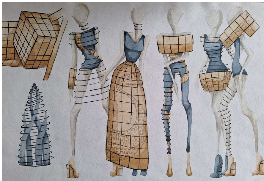
Рисунок 14.Зразки студентських робіт