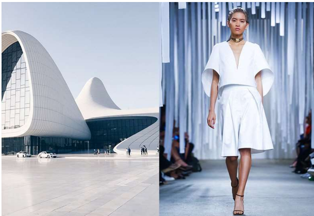
Рисунок 13. Колекція Mill

Отже, не дивлячись на різницю в матеріалах і масштабах, в основу архітектури і костюма покладені схожі закони формоутворення. Асоціативний зв'язок між архітектурною спорудою і костюмом, крім лінії і форми, можна також передати через колірне рішення. Ретельне вивчення кращих зразків архітектури дає дизайнеру могутній творчий поштовх в роботі із створення нових моделей.