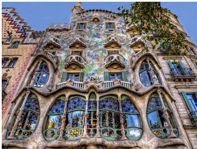
Рисунок 9.Архітектура Антоніо Гауді

Продуктивність цього джерела творчості забезпечується його спільністю з костюмом, наявністю низки властивостей – стійкістю форми, вертикальною спрямованістю форм, призначенням для людини. Навіть у смислового значенні поняття одягу пов'язане із поняттям житла. Є твердження, що архітектура виникла після одягу, побудована за його принципами як природне прагнення знайти засіб, аби прикрити людину, її вогнище і сім'ю від негоди. В основі архітектури лежить принцип модульності людської фігури. У принципах одягання простору в будівлю і людину в одяг є багато спільного.